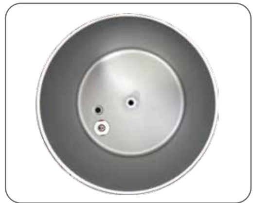
食品级不锈钢拉伸胆 无毒无锈无味