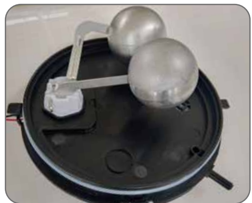
全系采用 304不锈钢浮球+食品级抗氧化PP